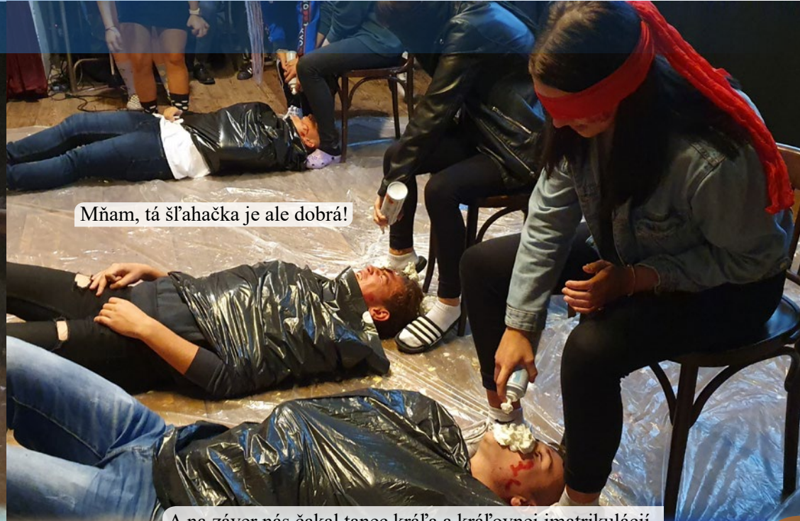
Mňam, tá šľahačka je ale dobrá!