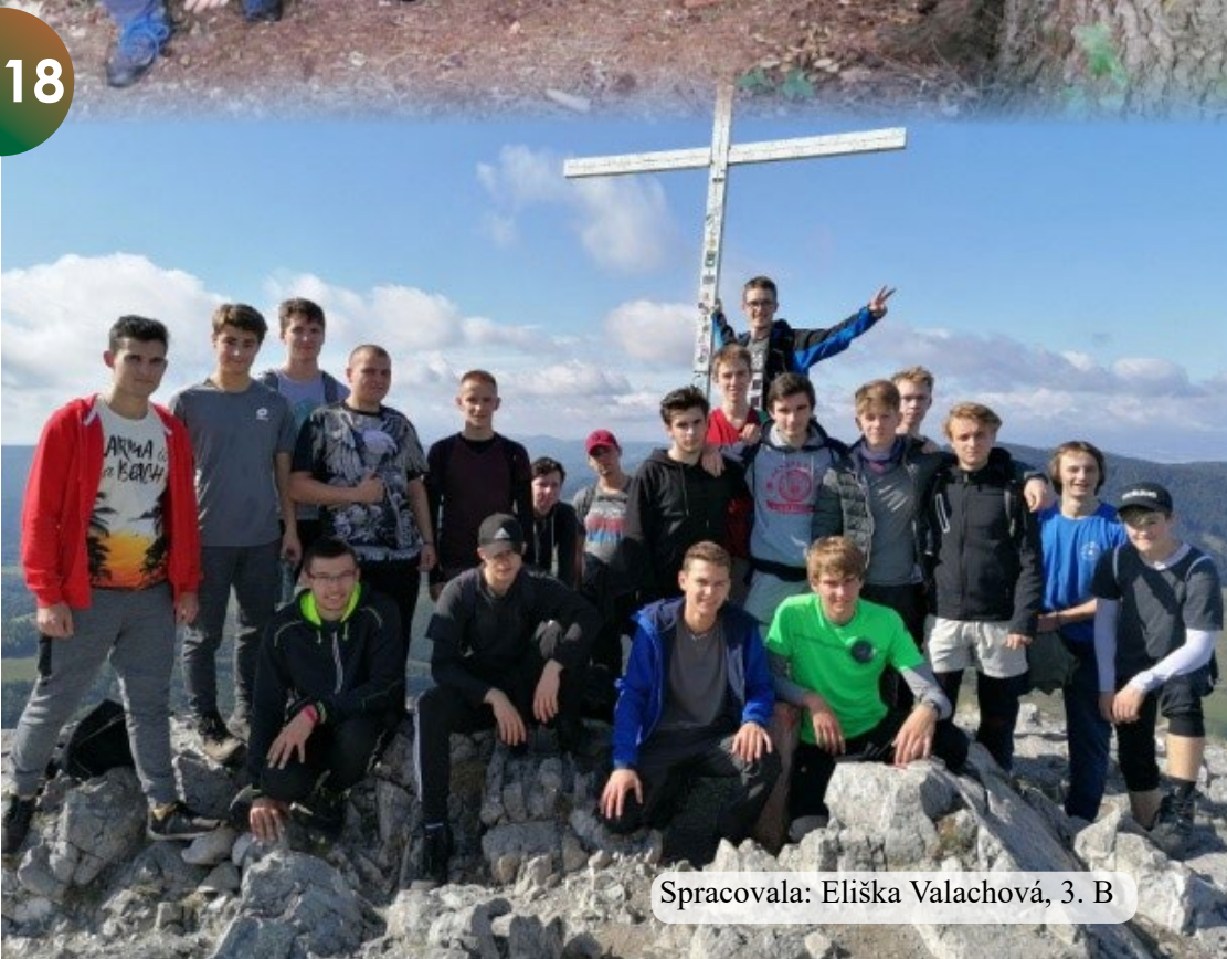
Spracovala: Eliška Valachová, 3. B