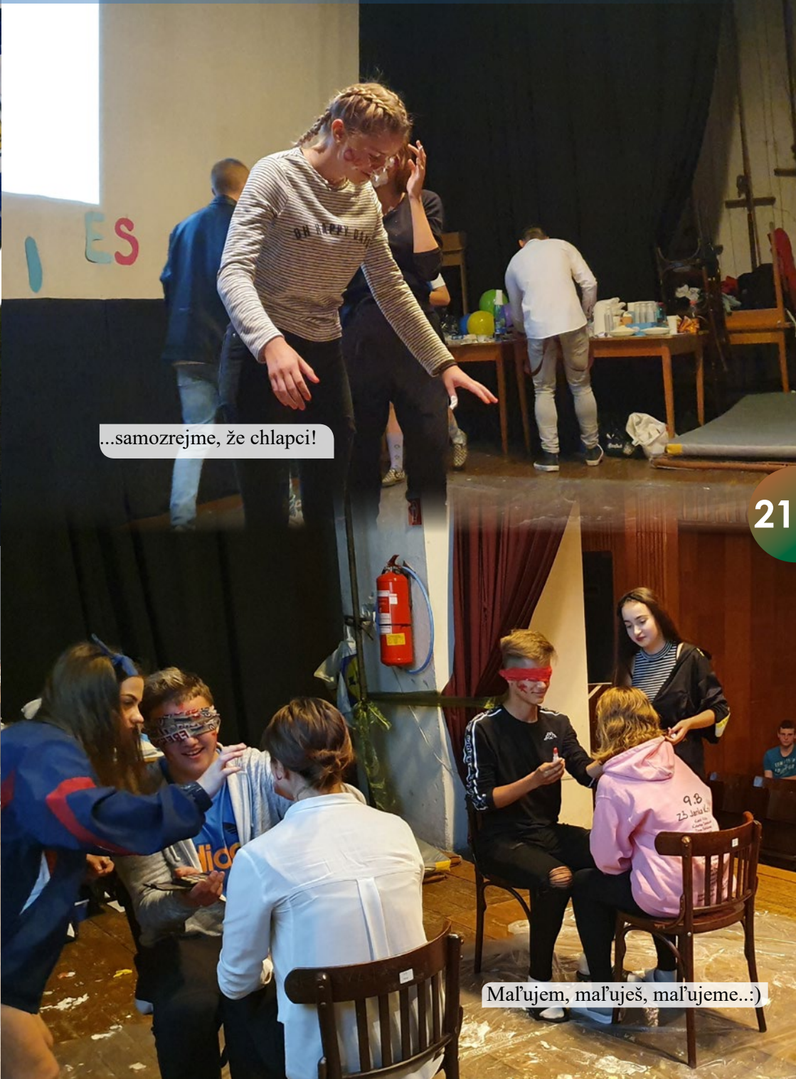
...samozrejme, že chlapci!

Úlohou bolo prevliecť vajíčko popod oblečenie. Čo myslíte, kto bol lepší, chlapci či dievčatá?