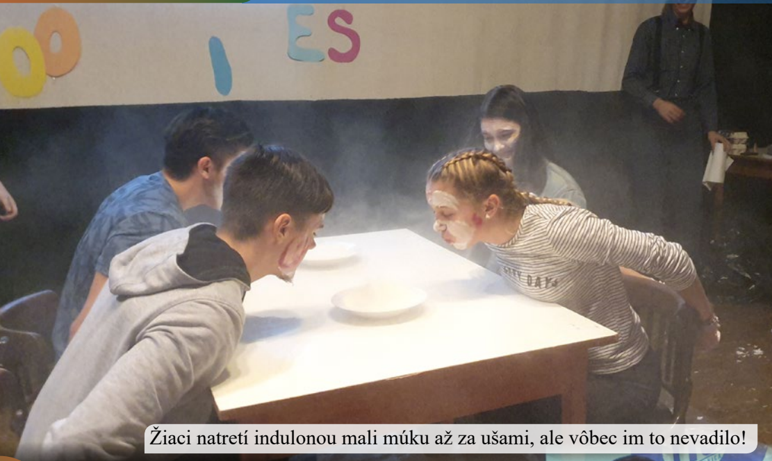
Žiaci natretí indulonou mali múku až za ušami, ale vôbec im to nevadilo!