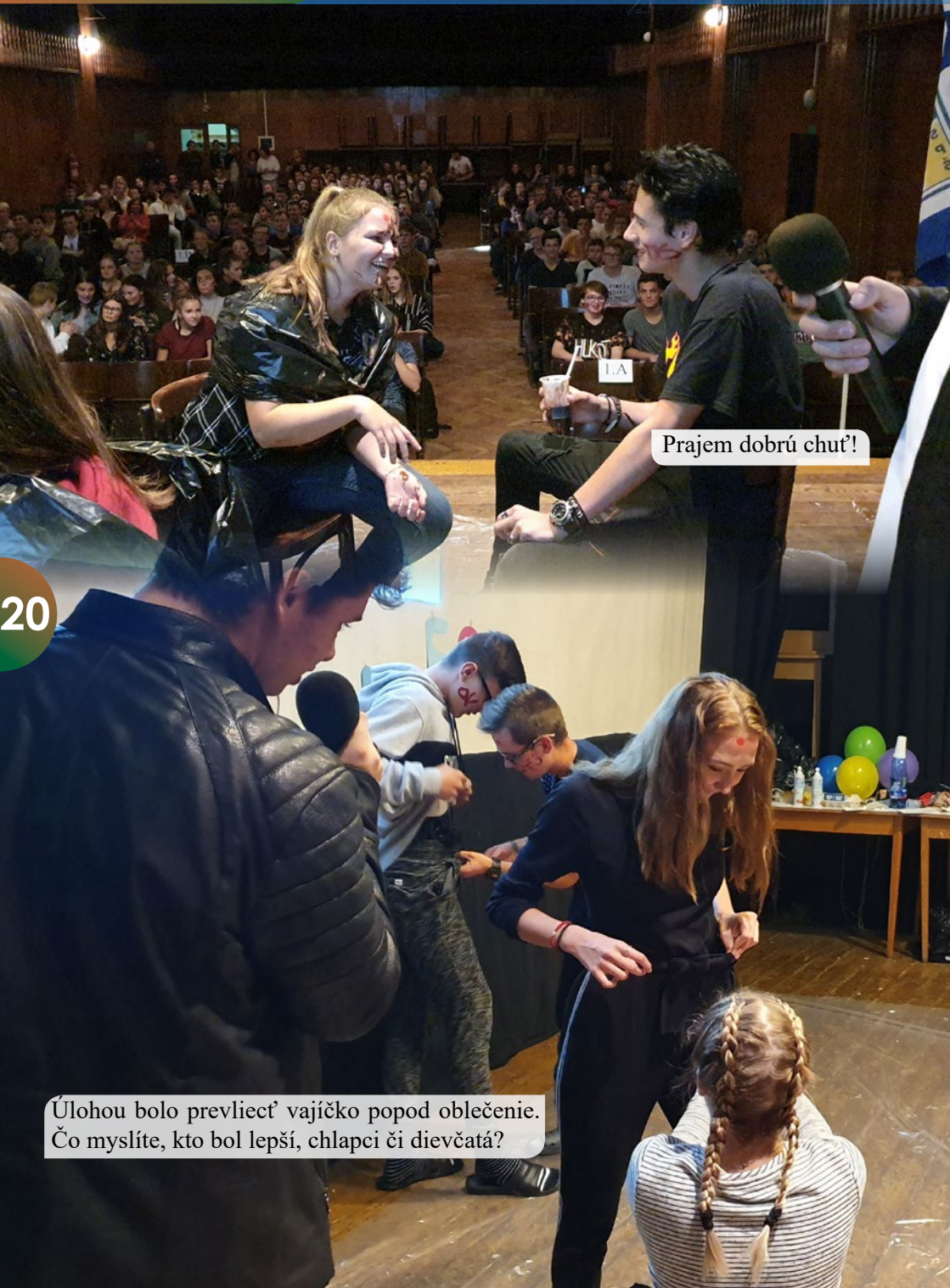
Prajem dobrú chuť!